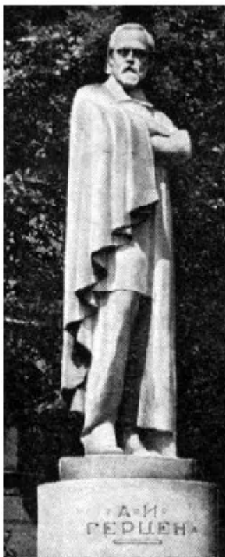
Памятник А. И. Герцену, 1922, скульптор Н.А.Андреев, Москва