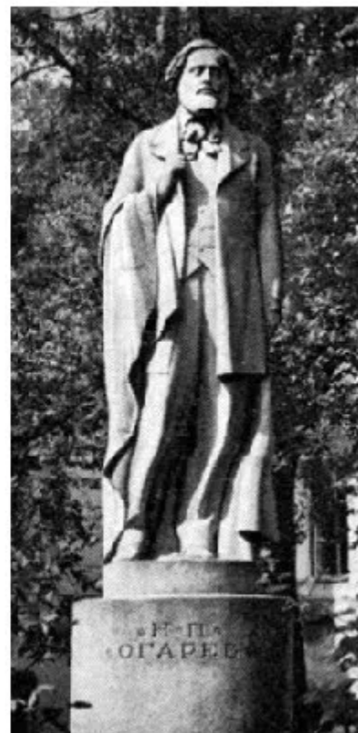
Памятник П. П. Огареву, 1922, скульптор Н.А.Андреев, Москва

Новой формой политико-воспитательной работы стала монументальная пропаганда. В соответствии с ленинским планом (весна 1918 г.) в первые годы после революции развернулось создание памятников известным мыслителям, революционерам, деятелям культуры ( за этим последовало разрушение памятников дореволюционной эпохи как не имевших художественного значения). В осуществление этой программы приняли участие Н.Ф Андреев, Л.В. Шервуд, С.Д.Меркуров, В.И. Мухина и др. скульпторы, приобретшие известность до революции. В 20-е гг. они создавали новые произведения, проникнутые революционным романтизмом и характеризовавшиеся монументализмом.