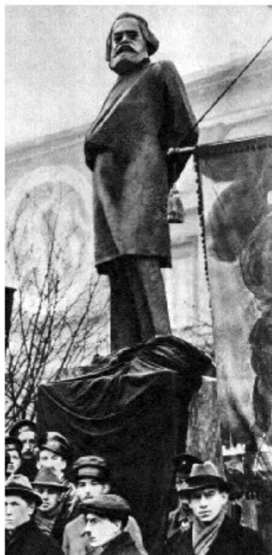
Памятник К. Марксу работы А. Матвеева. Ноябрь, 1918. Петербург